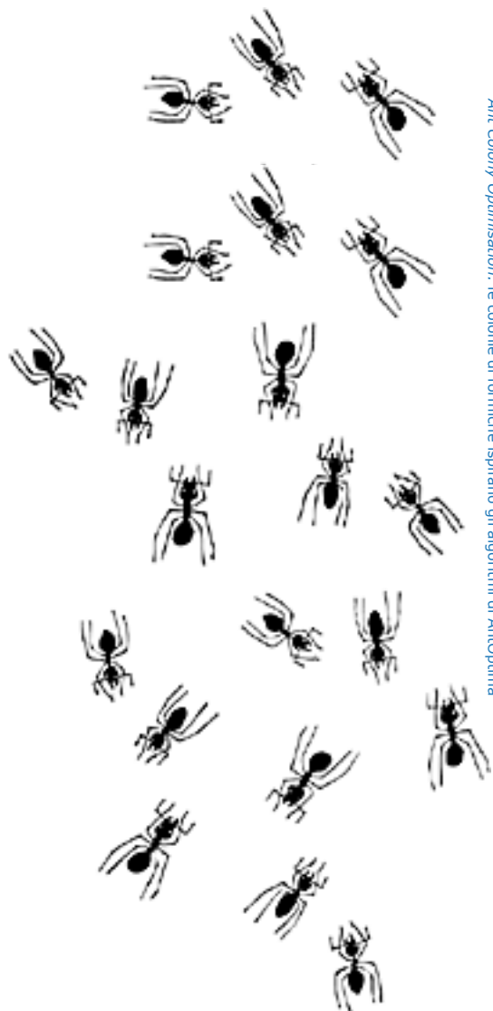
Ant Colony Optimisation: le colonie di formiche ispirano gli algoritmi di AntOptima

DyvOil funziona su personal computer con Microsoft Windows® ed è integrabile con tutti i sistemi informativi aziendali in commercio.