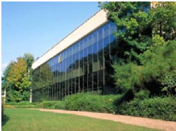
Istituto Dalle Molle di Studi sull'Intelligenza Artificiale (IDSIA)

Nachdem die Distributionsbedingungen formuliert sind, berechnet die innovative Technologie in wenigen Minuten optimale Lösungen. Inzwischen genießt die Optimierung durch sogenannte „künstliche Ameisen“ weltweite Anerkennung wie Publikationen in begutachteten Zeitschriften (Harvard Business Review, New York Times, Nature, Scientific American) aber auch die steigende Anzahl an internationalen Projekten (Mosca, Swarm-Bots) zeigen. Ausserdem werden sie in zahlreichen internationalen Forschungszentren erforscht und weiterentwickelt. Eine der führenden Organisationen ist das Schweizerische Forschungsinstitut für Künstliche Intelligenz in Lugano (IDSIA). Das Institut verhalf den Ameisen-Algorithmen insbesondere zum Durchbruch, weil es vorallem praxisorientierte Projekte mit industriellen Partnern erfolgreich realisierte mit der finanziellen Unterstützung der EU und der schweizerischen Kommission für Technologie und Innovation.